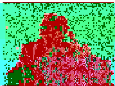
上校節(版)的執照，對這些，惟有經過適當的修訂中方可重新發行。

《上校節(版)》的執照，對這些，惟有經過適當的修訂中方可重新發行。《上校節(版)》的執照，對這些，惟有經過適當的修訂中方可重新發行。